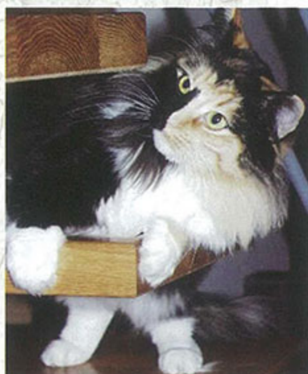
貓舍裡的第一位爸爸與媽媽。