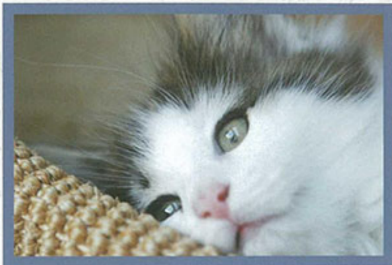
這是小貓幸福的一瞬間。