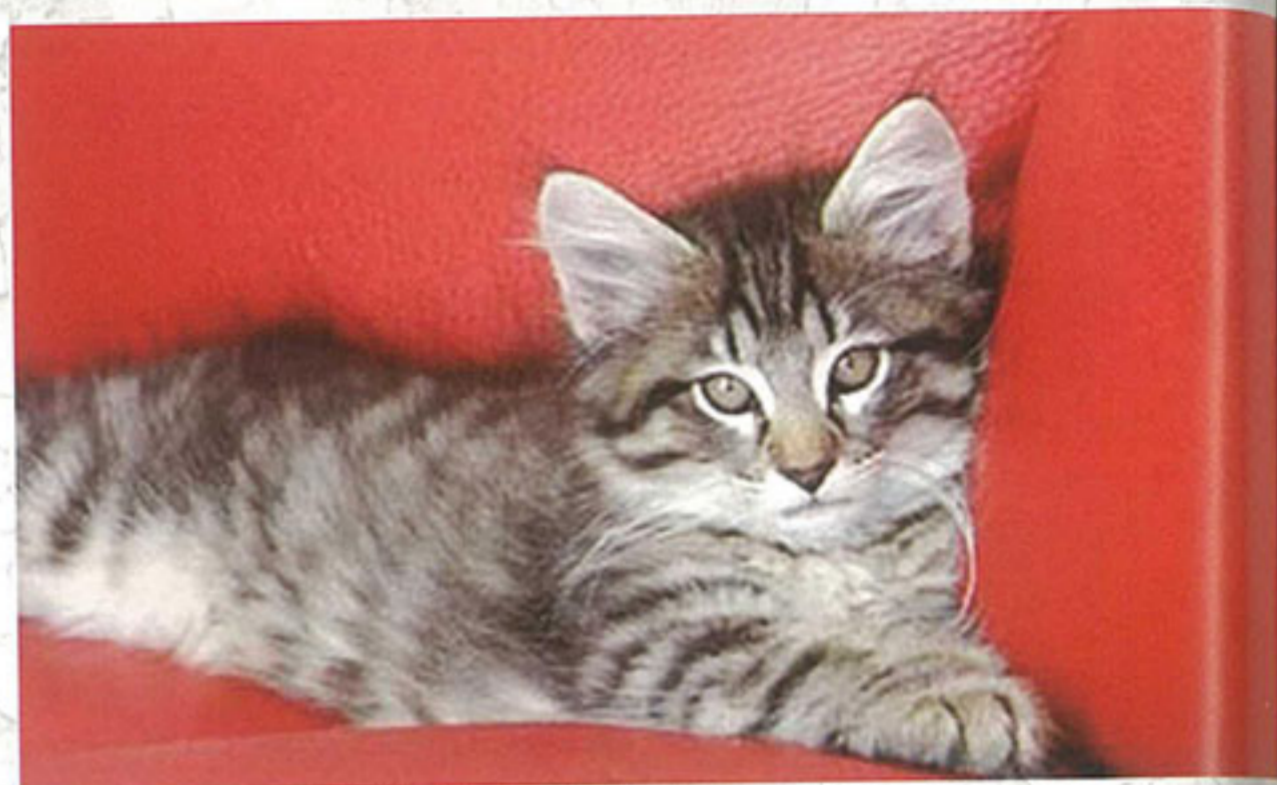
大紅中的小貓B，真是非常可愛。