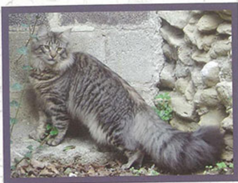
貓咪有著山貓般的野性外形，最愛四處探索。