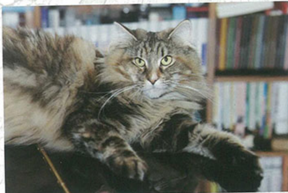
毛茸茸的披毛是抵禦寒冷的最佳裝備。