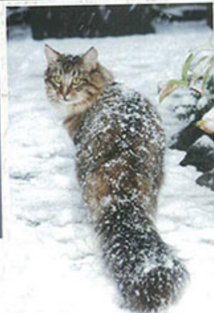
即使外面下著大雪，貓咪也得到花園走走。