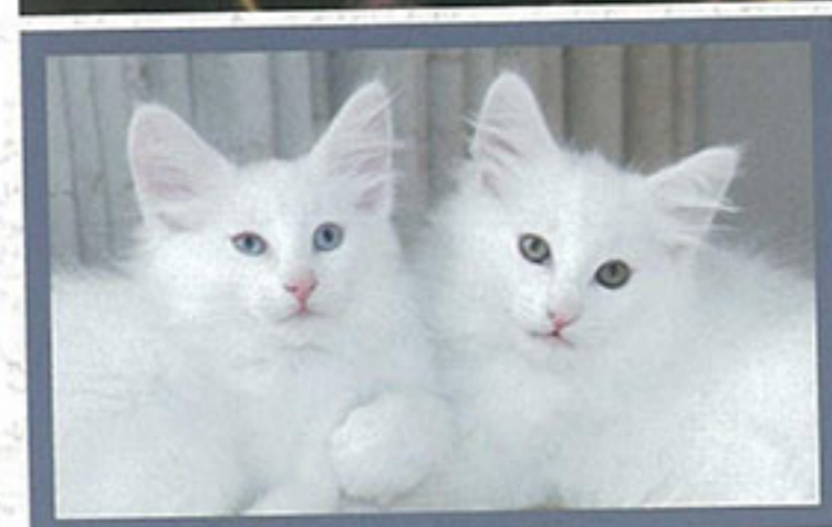
白雪雪的挪威森林貓，真係好似雪咁白！