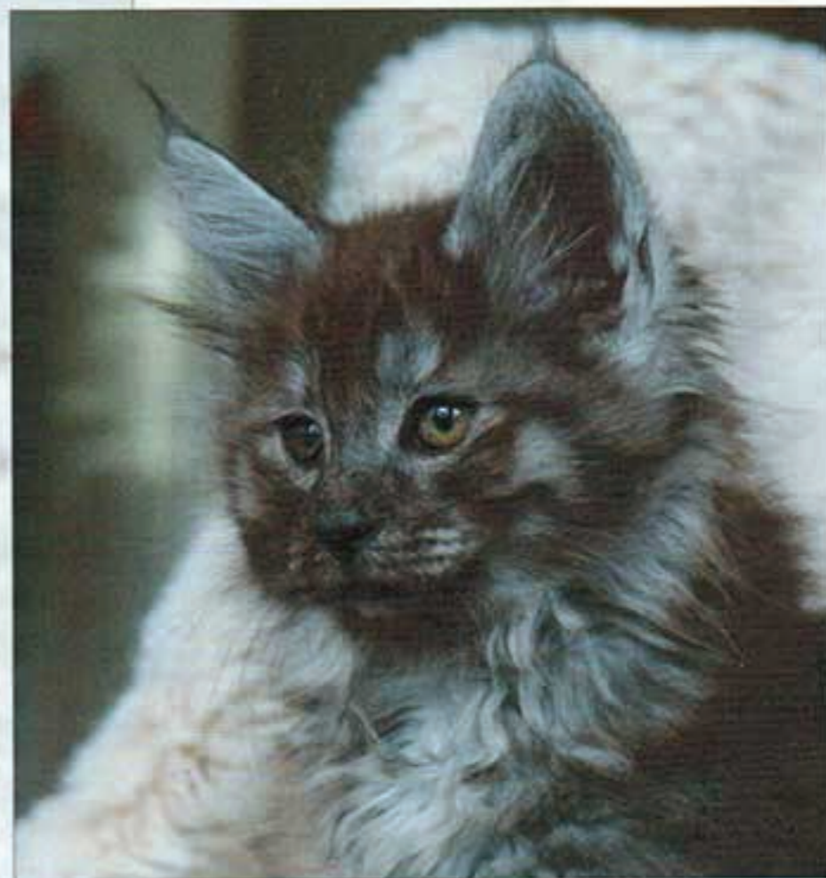
Miracle Smokey, broertje van Mylord Falstaff