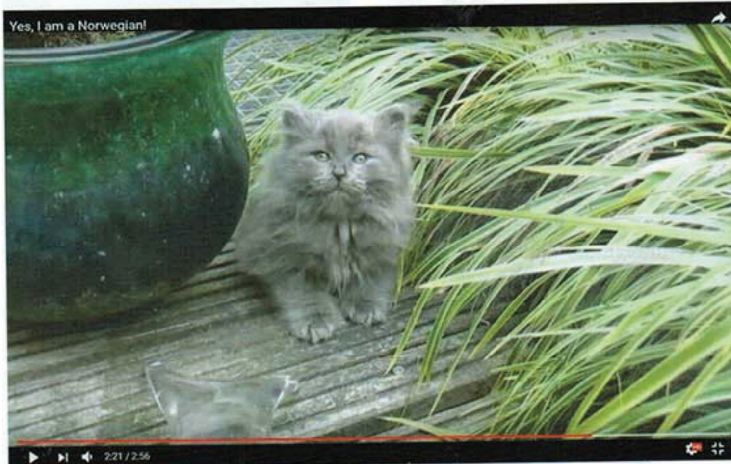
Een klein filmpje van Mylord Falstaff is te zien op You Tube: www.youtube.com/watch?v=a3MpdOm9uwU

Een paar dagen later, heb ik weer wat nieuwe foto's van Mylord Falstaff op FB en Flickr gepost en daarop kreeg ik een reactie uit Denemarken van een Noren fokster die vermeldt dat van de gelijknis van mijn verhaal met een kitten van haar met dezelfde symptomen, ge-